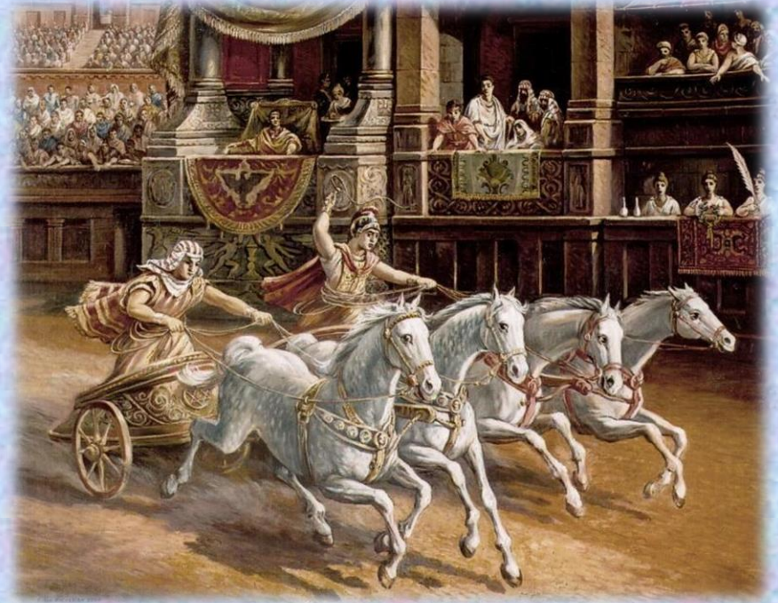
CORSA CON LA QUADRIGA