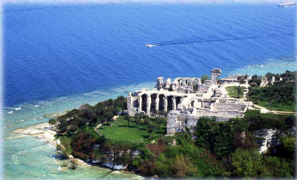
Villa di Catullo, sul lago di Garda.