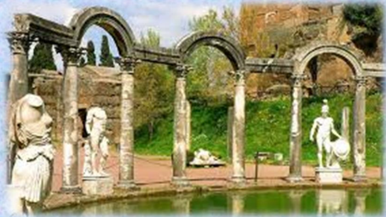
Villa Adriana a Tivoli, costruita dall'Imperatore Adriano.